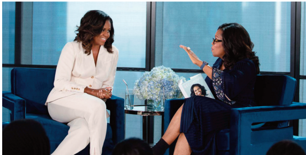
Figura 1. Michelle Obama (izquierda) junto a Oprah Winfrey (derecha) en una de las entrevistas realizadas para promocionar el libro Becoming . Revista Cosmopolitan , artículo a cargo de Oprah Winfrey, edición digital. Hearst Communications, 2018.

La afirmación de Fout no es para nada casual: el relato biográfico introduce, de manera subrepticia, una narrativa que ha sido explícita en su marido (como históricamente lo fue en el cuerpo presidencial de los Estados Unidos), y detrás de esta connotación aparece un signo epocal. Pues, de un tiempo a esta parte, el Sueño Americano ha cobrado visibilidad en el mundo del espectáculo, no solo como un redundante lugar común que bucea por los discursos más triviales de las estrellas, sino como una deriva de este conglomerado ideológico que, en un estadio de mayor contemporaneidad, Jim Cullen ha definido como “el Sueño de la Costa Oeste” (2003: 163).