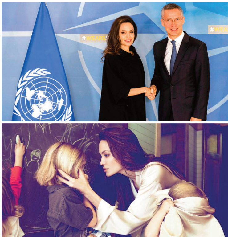
Figura 4. Arriba: como enviada especial de la ONU, Angelina Jolie reunida junto a Jens Stoltenberg, secretario general de la OTAN. La reunión en Bruselas, el 31 de enero de 2018, se abocó a tratar la violencia sexual en las zonas de conflicto.

Abajo: Sesión en donde la actriz se aboca a narrar la forma en que su trabajo humanitario se entrelaza con su rol de madre y, al mismo tiempo de actriz. En la encrucijada con el glamour de la moda y la filantropía, el Sueño Americano aparece como una metáfora densa en la nota que acompaña. Fotografía de Mert Alas y Marcus Piggott, Vanity Fair , núm. noviembre de 2011, Condé Nast Publications.