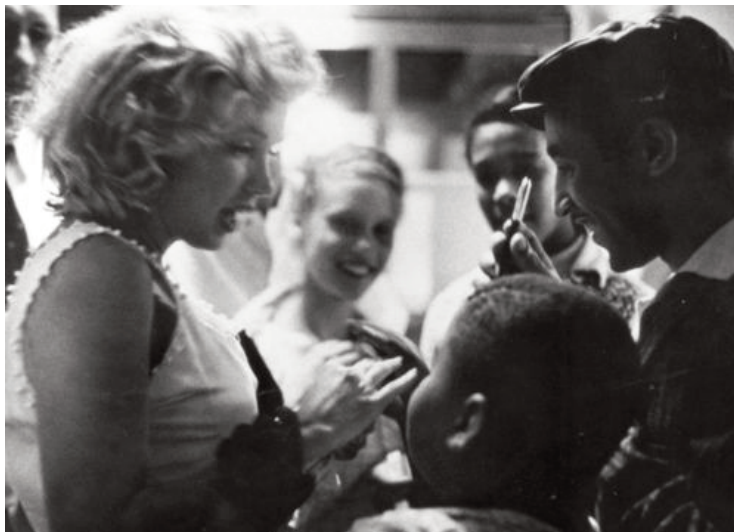
Figura 2. Un claro ejemplo del culto a la celebridad: Marilyn Monroe firma autógrafos ante una horda de fans. New York, 1957.

Studios, Paramount Pictures y, poco después, Metro-Golwyn-Mayer) y la fundación de Hollywood: el entonces pequeño poblado de la costa oeste donde emigrarán masivamente los cineastas del país, en tanto ofrecía las condiciones espaciales predilectas para los rodajes. En este contexto, tendrá lugar un paulatino proceso de mitificación bajo el cual actor y personaje comienzan a perder la nitidez de sus formas. Personalidades tales como Lon Chaney, Luis Brooks o Barbara La Marr lograrán escapar de los créditos para adquirir renombre en un medio que cobraba más y más visibilidad en el mundo. Y aunque la incorporación del sonido eclipsará a muchas de estas incipientes celebridades (cuando actores y actrices debían tener una voz que respondiese a la imagen representada, Cfr. Arias Carrión, 2011), la estrella abre su paso en este sinuoso camino de legitimación pública como una nueva figura cultural.