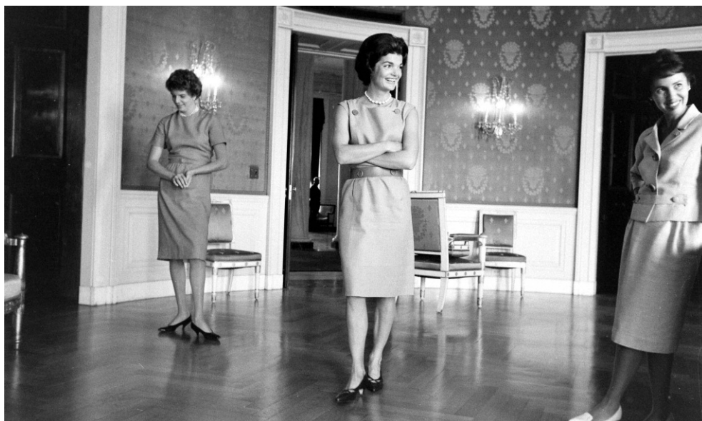
Figura 3. Jacqueline Kennedy mostrando, ante las cámaras, los interiores de la Casa Blanca. A Tour of the White House with Mrs. John F. Kennedy [Programa de Televisión], Perry Wolff [Productor], CBS / NBC, 1962.