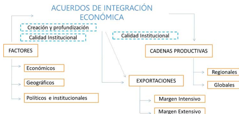
Gráfico 1: Acuerdos de Integración Económica

La fragmentación y relocalización de los procesos productivos se ha generalizado durante los últimos años en numerosos países. Tienen la ventaja de que las distintas etapas de producción pueden estar localizadas en países especializados en la producción de insumos o bienes intermedios necesarios para la producción de los bienes finales. Este proceso permite aumentar la variedad de productos y reducir los costos de producción de las empresas y, en consecuencia, disminuir el precio de los bienes finales. Por