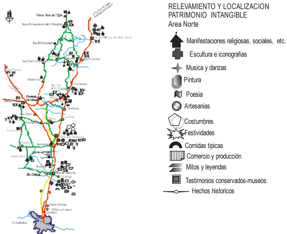
Fig. 3: Localización de Recursos del Patrimonio Intangible

Se realizaron viajes a los poblados recabando información bibliográfica, documentos gráficos, publicaciones del lugar, observación directa registrada en imágenes fotográficas, entrevistas a informantes claves y a miembros de la comunidad.