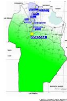
Fig. 2: Mapa Provincia de Córdoba

Existiendo este valiosísimo patrimonio cultural tangible y valorando además de los paisajes naturales y los sitios históricos, las manifestaciones culturales en todos sus aspectos: costumbres, festividades, tradiciones, músicas, danzas, ritos, leyendas, etc., que nos dan testimonios de una región con un pasado protagónico insuficientemente reconocido, entendiendo que tanto lo tangible como lo intangible conforman la cultura de los distintos grupos sociales. Por todo esto promovemos continuar el desarrollo de la Región Norte de la Provincia de Córdoba, aun postergada, posibilitando su gestión y poniendo en valor su cultura e identidad.