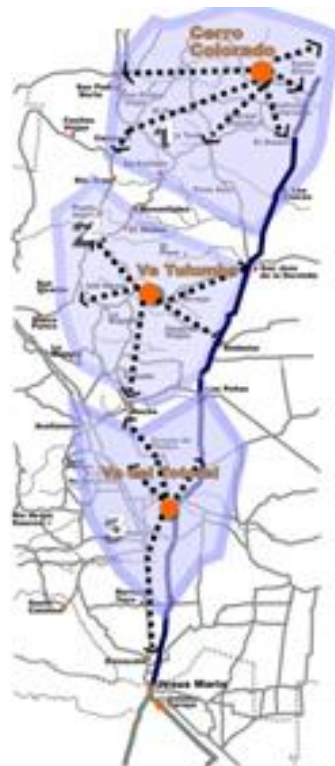
CIRCUITO N° 3 PLANO DE LOS SUB-CIRCUITOS ALTERNATIVOS

puede comprender los modos de vida y costumbres a través del equipamiento, mobiliario, y utensilios, y posterior almuerzo con comidas típicas.