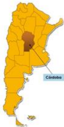
Fig. 1: Mapa Rep. Argentina