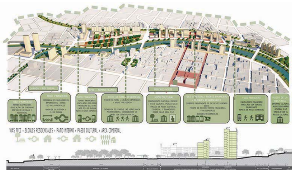
Fig. 6. Propuesta Proyecto Urbano Área borde Norte Área Central Córdoba. Grupo de estudiantes: Cargnelutti, Benítez, Campos. Taller Prof. Asist. Arq. Guillermo Mir. 2013.

Estos trabajos prácticos nos permiten ensayar la realización de este tipo de proyectos en áreas de diversas escalas espaciales, con localizaciones pericentrales, con programas mixtos y complejos, con un detallado diseño del espacio público, con desarrollos normativos y con reflexiones sobre los posibles mecanismos de gestión.