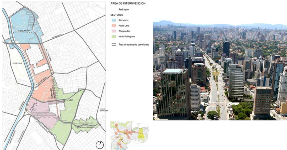
Fig. 2 y 3. Área de intervención de la operación Urbana Faria Lima y fotografía de la extensión de la Av. Faria Lima, vista desde cruce Bvd. Kubitschek hacia Av. Cidade Jardim

En los aspectos funcionales , se mixturaron usos residenciales con comerciales y de servicios. En los aspectos morfológicos , se produce una sustitución de edificaciones horizontales por verticales en formas de torres de oficinas, edificios residenciales y complejos de usos mixtos, de alto nivel constructivo. El incremento en los valores de FOT incentivó la reparcelación y unificación de lotes (Fig. 2 y 3).