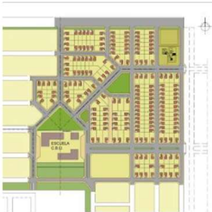
Gráfico No. 4: Conjunto residencial Barrio VICOR II.

Lo más significativo que se remarca como característica recurrente en este tipo de intervenciones es la barrera física que constituye el límite entre el barrio y el resto del entorno: basura, límites físicos como bordes y barreras suburbanas constituidas por áreas desarticuladas e inaccesibles.