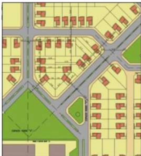
lo privado y lo público

Lo más significativo que se remarca como característica recurrente en este tipo de intervenciones es la barrera física que constituye el límite entre el barrio y el resto del entorno: basura, límites físicos como bordes y barreras suburbanas constituidas por áreas desarticuladas e inaccesibles.