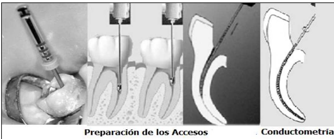
Preparación de los Accesos