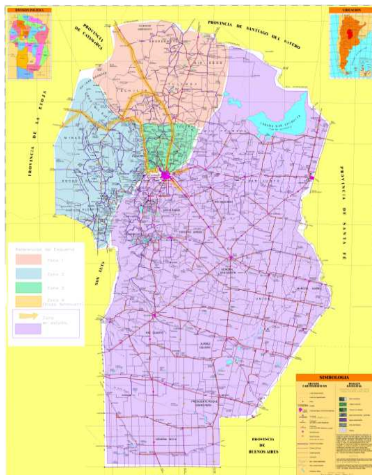
Figura 04- Primera delimitación de regiones en la provincia de Córdoba. Fuente: Elaboración propia.

La figura 04 muestra la delimitación de regiones con la estructura interna de la región NO en base a las vías de comunicación.