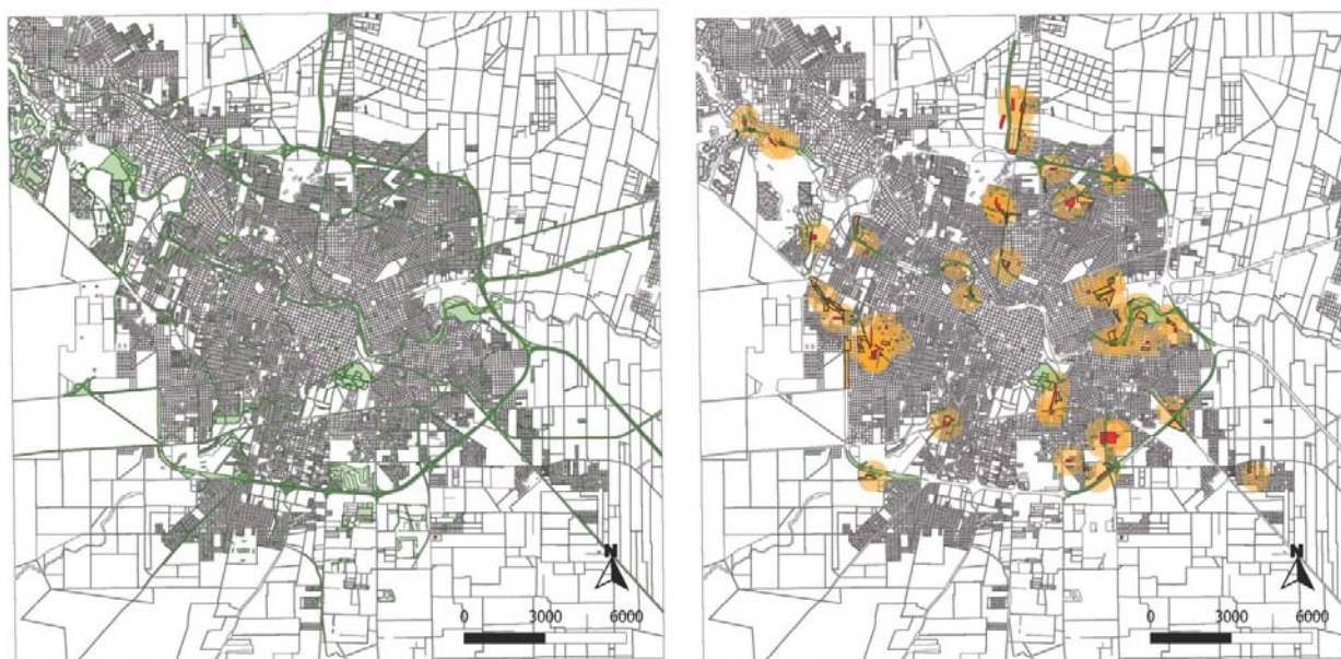
Gráfico 2: Izquierda: Áreas verdes Elaboración propia en base a información de la Dirección de Espacios Verdes, 2012. Derecha: Sumatoria de problemáticas anteriormente descritas. Elaboración propia. Procesamiento gráfico y Gis Miguel Martiarena

En segunda instancia se extrajo la información demográfica de la población de dichos sectores, categorizando el impacto según la vulnerabilidad, obtenida de la desagregación de los radios censales (DIGEC, 2008) en relación a la superficie construida, clasificada utilizando una imagen satelital Landsat de 7 de junio de 2010. Las cartografías producidas posibilitaron la selección de algunas zonas de la ciudad para su análisis particular según el carácter más crítico detectado (Gráfico 3).