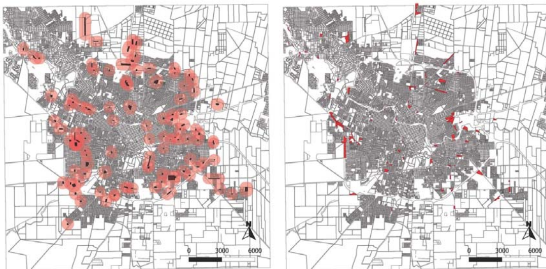
Gráfico 1: Izquierda: Basurales a cielo abierto con un radio de influencia de 500 m. Elaboración propia a partir de mapa realizado por el Observatorio Urbano de la UNC, 2009. (Sobre base Pliego licitación de RSU. MC 2008). Derecha: Villas de emergencia. Elaboración propia en base a mapa realizado por el Observatorio Urbano de la UNC sobre relevamiento Pictor 20464 (Buthet, Lucca, Peralta et al 2010) con actualización provista por catastro Un techo para mi País. Procesamiento gráfico: Miguel Martiarena