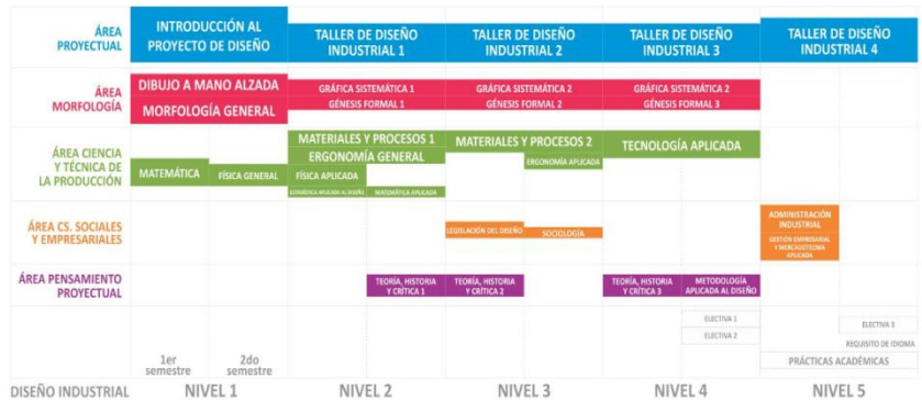
Fig. 1 Incidencia de Áreas del conocimiento, por horas cátedra y por nivel en la carrera de Diseño Industrial.

En la propuesta para el desarrollo del Área Morfología de la Carrera de Diseño Industrial no podemos dejar de señalar, qué lugar ocupa el área, en el entramado de conocimientos impartidos en la carrera, desde la perspectiva temporal, medida en horas cátedra a dictar. En el gráfico están ausentes, las horas extra-áulicas, que el estudiante debe desempeñar y que en realidad quedan libradas al criterio de cada asignatura, dado que no existe contralor formal y que sin dudas deben ser objeto de análisis.