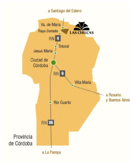
Figura 1: Mapa ubicación provincial del establecimiento Las Chilcas S.A del establecimiento

El Establecimiento Agropecuario “Las Chilcas” se encuentra en el norte de la Provincia de Córdoba, a 179 km de la capital, sobre la Ruta Nacional 9 Km 868, entre las localidades de Rayo Cortado y Villa de María de Rio Seco.