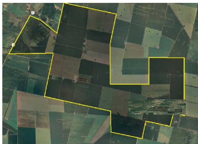
Figura 3: Mapa satelital establecimiento