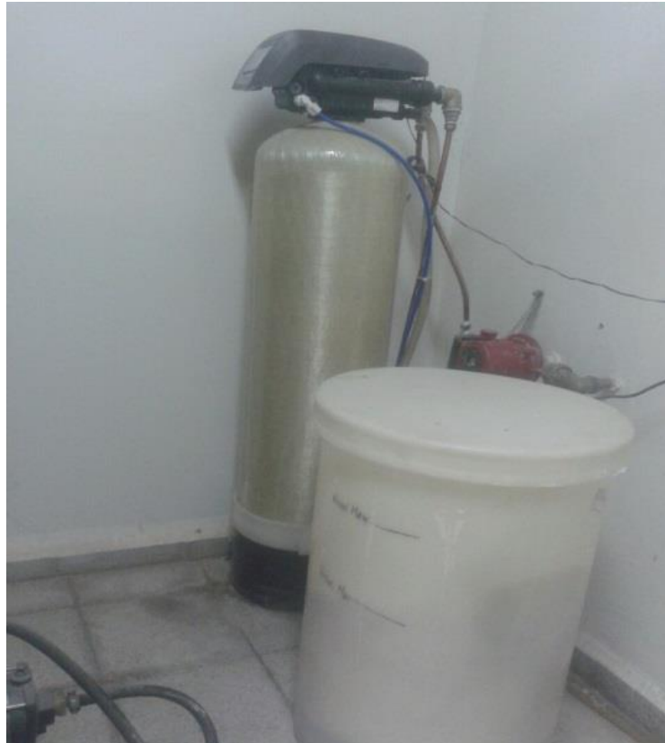
Figura (4) Ablandador de agua