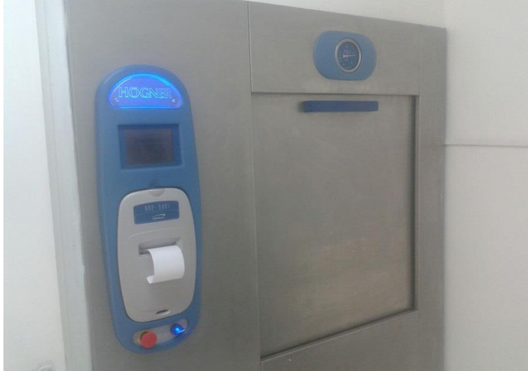
Figura 6. Autoclave en funcionamiento.