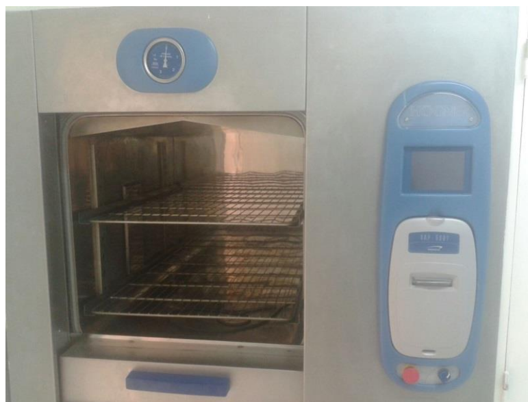
Figura (5) Autoclave Marcas HOGNER 550