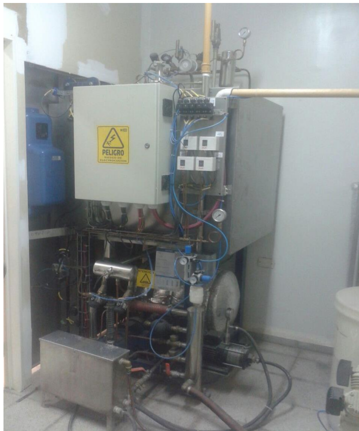
Figura7. Tablero electrónico del Autoclave.