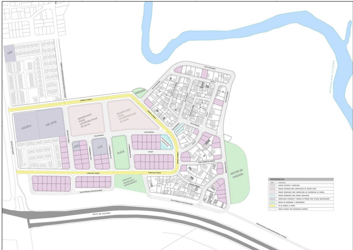
Figura 2 - Plano de propuesta urbana - Equipo Técnico UEEA-PIAI (2019) - Base: CSI-IPRU (2015) - Proyecto ejecutivo Asentamientos Parque Cauceglia/Nuevo Cauceglia/Villa Libre e Intendencia de Montevideo/División Vialidad/Construcciones viales (2019) - Ajustes de proyecto.

Se prevé la reserva de terrenos para policlínica y CAIF, que se detallan más adelante. Espacios de recreación y esparcimiento, también siguiendo otra de las directrices del POT “(...) prever espacios verdes y otros equipamientos que designe el Plan, con la base de estructuración del suelo urbano.” 4