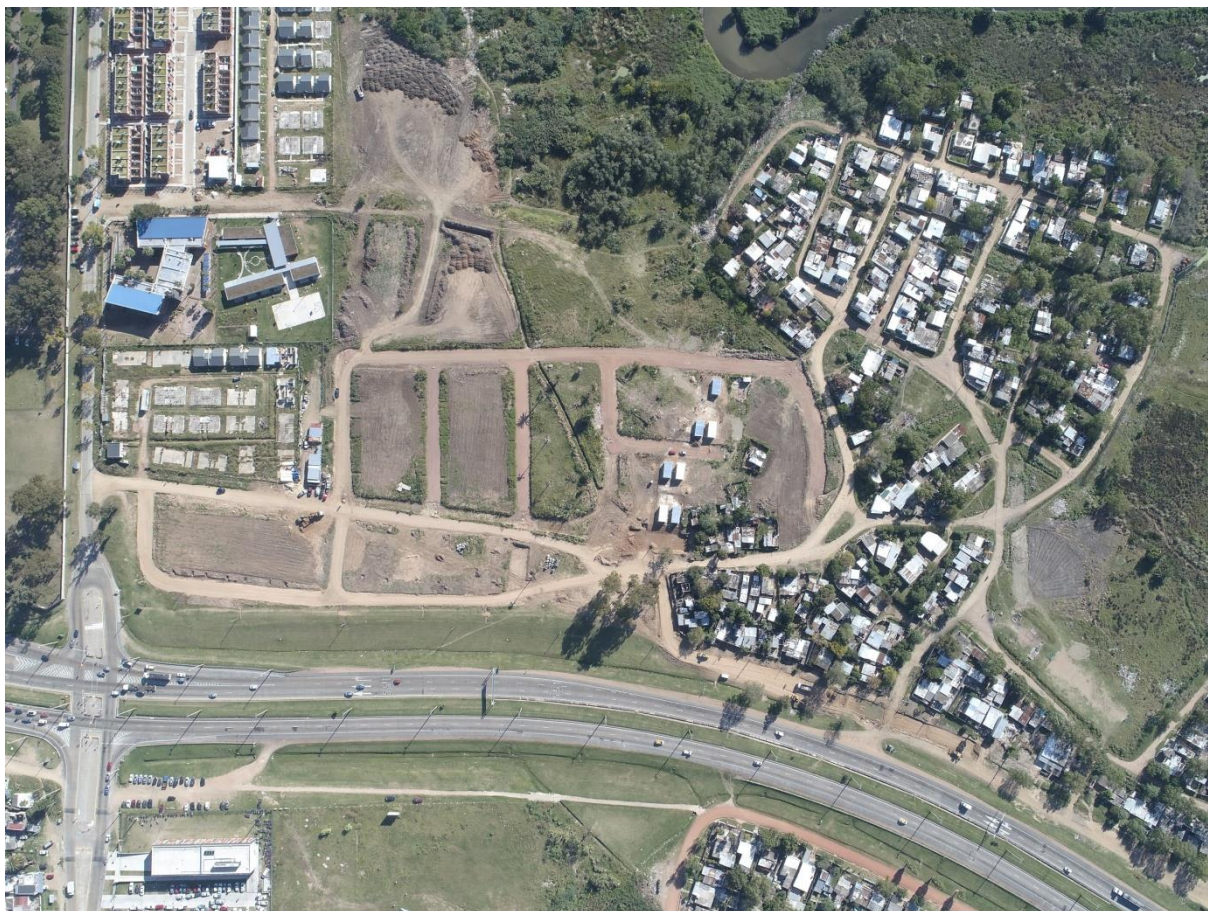
Figura 1 - Foto aérea de los barrios Nuevo Cauceglia, Parque Cauceglia y Villa Libre tomada el 10/04/2019

Sobre las obras de infraestructura que están previstas para la intervención en Cauceglia, se proyecta la conexión a colector de saneamiento del total de las viviendas, asegurando de esta forma una mejora en la calidad habitacional y ambiental de la zona. Red de alumbrado público, de energía eléctrica y de agua potable en la totalidad del barrio. Si bien los asentamientos ya cuentan con esta infraestructura, la misma es muy precaria, insuficiente e insegura. Además, los tendidos nuevos deberán ajustarse a la propuesta urbana proyectada. En el caso de la energía eléctrica y el agua potable la intervención también busca regularizar la forma en que los usuarios hacen uso del servicio, debido a que gran parte de ellos están conectados en forma irregular.