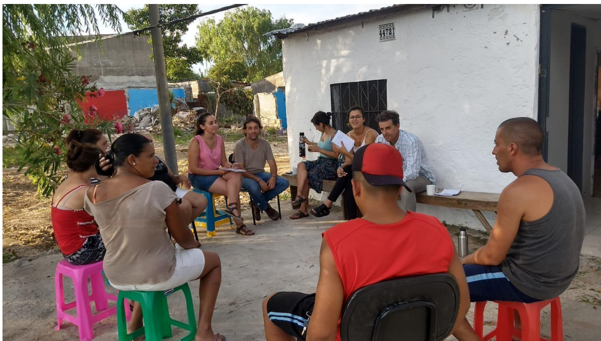
Figura 5 - Foto reunión de seguimiento de proyecto. Febrero 2019

En la intervención se entiende necesario el trabajo transversal cotidiano con los vecinos/as en relación a todos los ejes del proyecto: de su estar/involucrarse dependerá la apropiación de los cambios que se van desarrollando y su empoderamiento como propiciadores de actividades en su comunidad. Desde diciembre de 2017 se conforma quincenalmente con un grupo de vecinos/as la “comisión de seguimiento de proyecto”.