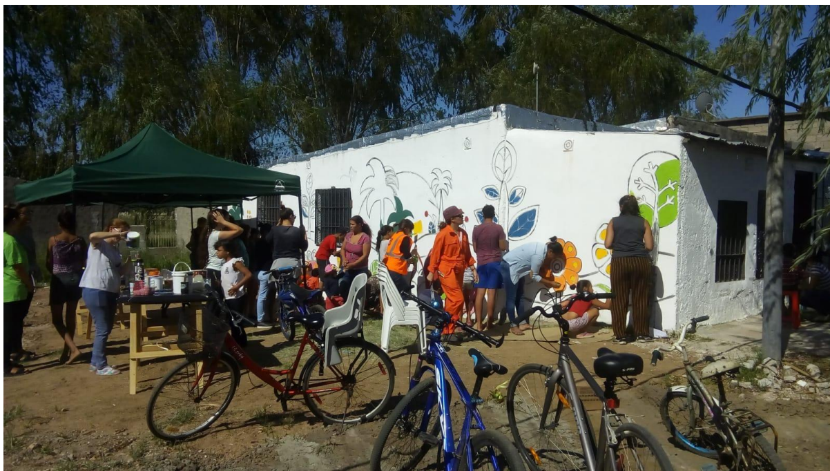
Figura 4 - Foto de actividad pintada del Local Barrial junto a vecinos/as. Año 2019

Se han ido incrementando y ajustando las coordinaciones y hoy la presencia de las organizaciones tanto estatales como de la sociedad civil ha aumentado. De esta forma, se ha contribuido a acortar la distancia que existía entre organizaciones/ territorio. Otra acción que ha potenciado positivamente al desarrollo barrial fue reutilizar una vivienda que quedó vacía para uso del equipo, tanto para actividades del proyecto como comunitarias. Este espacio se identifica como “Local Barrial”. La re significación de este espacio fortaleció el desarrollo de actividades con niños/as y adolescentes, brindó un espacio para reuniones con vecinos/as adultos y permitió la posibilidad de que otras organizaciones que trabajan en la zona lo utilicen para sus actividades.