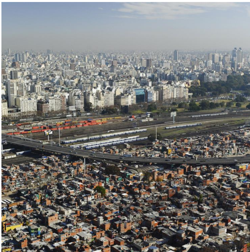
Figura 1: Imagen aérea del Barrio 31 y 31 bis.

Se trata de un territorio en disputa. Lo que en esa época era un área de servicio de la Ciudad, hoy en día es un área central de nuestra capital, donde los desarrolladores inmobiliarios y sus eventuales socios en los gobiernos proyectan extraordinarios negocios para los cuales erradicar e impedir la urbanización de este barrio pasó a ser el objetivo principal. Derecho a la radicación y urbanización: En 2009 la Legislatura de la Ciudad Autónoma Buenos Aires sanciona la Ley 3343 que dispone la urbanización del barrio 31 y 31 bis, y organiza una Mesa de Trabajo y Gestión participativa conformada por representantes de los gobiernos nacionales, de la ciudad, la universidad y los habitantes, que definió los lineamientos del proyecto de urbanización. Organización del barrio 31 o Barrio Carlos Mujica (como lo llaman sus habitantes) se subdivide en 9 barrios organizados en manzanas irregulares: Comunicaciones, YPF, Autopista, Inmigrantes, Güemes, Cristo Obrero, Ferroviario, Galpones, San Martín. Cada uno de ellos tiene su autonomía y sus Juntas Barriales. Existe además, un Cuerpo de Delegados conformado por 122 delegados elegidos por manzana y un Consejo compuesto por 10 consejeros que representan a la totalidad del Barrio.