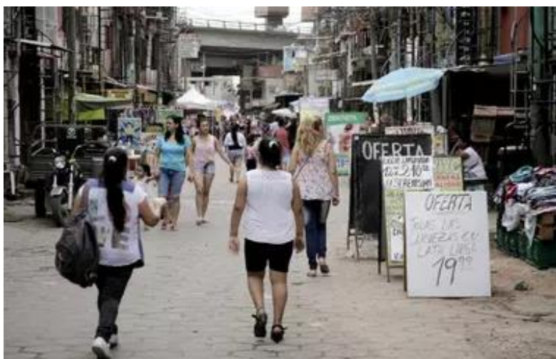
Figura 3: Polo gastronómica La Florida.

En los casos que esto ocurre inicialmente podemos identificar procesos de gentrificación en curso. Pero a primera vista, existe un proceso de empoderamiento de la población que ha podido desarrollar pequeños negocios que les permiten mejorar su nivel de vida a través del desarrollo del polo gastronómico llamado La Florida.