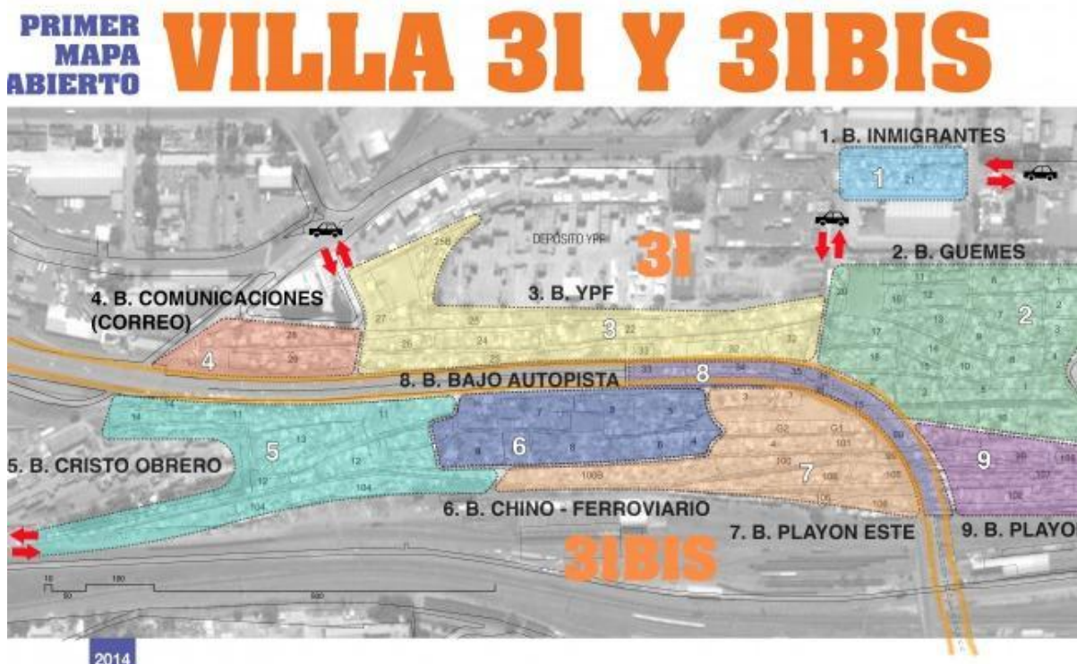
Figura 2: Mapa abierto Villa 31 y 31 bis, fuente: Télam.

Las condiciones que sumergen a este barrio en territorios en disputa vienen dadas por la estructura social del mismo entre otros aspectos, considerando por ejemplo que más del 50% de la población es de origen extranjero, mientras que solo el 29% es nativo de la ciudad. De la población extranjera la mitad es nacida en Paraguay, 30 % en Bolivia y menos del 20% en Perú. Esta configuración sociocultural dificulta la existencia de patrones culturales propios que le permitieran a la población una identidad propia, así como un proyecto propio de desarrollo local. Estos procesos configuran exclusión social entendiéndola no como un estado, sino como un proceso, que como tal debe ser enmarcado históricamente Castel (1997). Aspectos tales como la precariedad laboral, ausencia de sistemas de salud así como pobres soportes relacionales, van construyendo una zona de vulnerabilidad que aglomera a gran parte de la población del lugar.