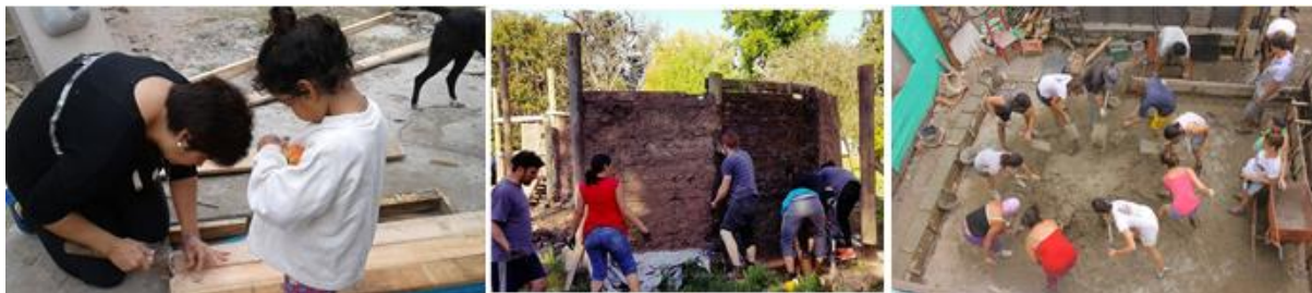
Figura 4: Imágenes de Jornadas de construcción colectiva.

Entre 2014 y 2016 se trabajó en el programa El Pueblo Construye, pensado e impulsado entre ArqCom (LP) y Unión del Pueblo. En esta propuesta retomó la idea de las cuadrillas solidarias de la Venezuela chavista 5 , y se buscó dar respuesta a las dificultades surgidas después de la inundación del 2013. Si bien la Provincia de Buenos Aires había destinado fondos para entregar materiales para la reconstrucción de viviendas, no se contempló el asesoramiento técnico ni la mano de obra. Esta situación dio origen a impulsar la construcción solidaria entre beneficiarixs, donde se trabajó en la casa propia y en la ajena. El Pueblo Construye permitió en principio el mejoramiento de aproximadamente 20 viviendas en tres asentamientos. En el proceso surgieron procesos de intercambio de materiales entre viviendas, e instancias de organización entre vecinxs que superaron los objetivos originales del programa.