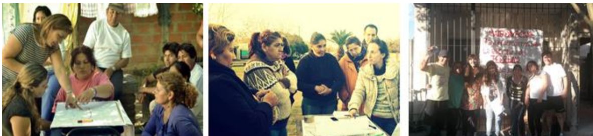
Figura 7: Imágenes de talleres de regularización dominial

Los talleres de regularización dominial vinieron también a responder demandas de vecinxs de los barrios. A partir de la coordinación con estudiantes de abogacía y organizaciones sociales, se realizaron estos talleres donde se difundió información acerca de cómo acceder a la escrituración de las tierras en los barrios populares, poniendo el foco en que esa escrituración sea la vía por la que acceder a programas de mejoramiento habitacional.