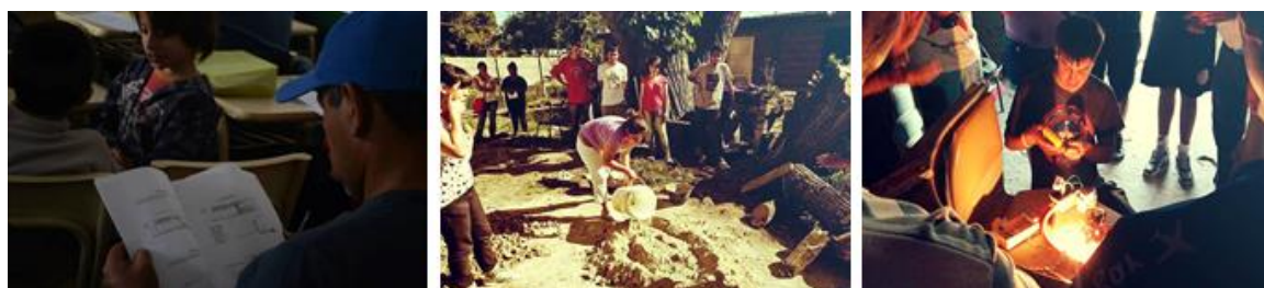
Figura 3: Imágenes de Talleres de Lectura de planos, de Construcción y de Electricidad

La Capacitación en Oficios surgió de necesidades presentadas por vecinxs de los barrios. Los Talleres de Oficios son una forma de transmitir conocimientos adquiridos en la academia, sumados a aquellos saberes traídos por trabajadorxs de la construcción que habitan los barrios. Por ello es que son coordinados y pensados entre vecinxs e integrantes de organización. Hasta el momento se han desarrollaron talleres vinculados a tres oficios: construcción, electricidad y seguridad en la vivienda, lectura de planos de obra.