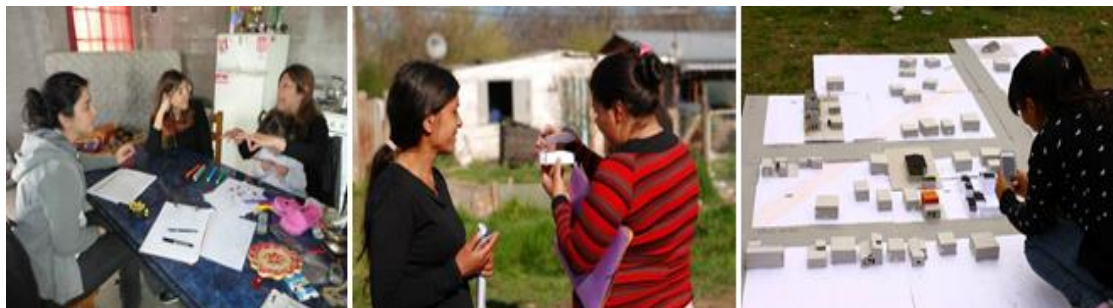
Figura 2: Imágenes de Consultorios de viviendas y de Talleres Colectivos de viviendas

Durante los años 2012 y 2013 se inició el trabajo bajo el formato de “consultorios barriales de arquitectura”, en los barrios Gambier y 155 y 58 de Los Hornos. Entre ambos barrios se trabajó con cinco familias a partir de la articulación con un partido político. El objetivo era aportar las herramientas técnicas a cada familia para mejorar el estado de las viviendas. Para el desarrollo de los talleres se comenzó con una etapa de recorrida por los barrios y