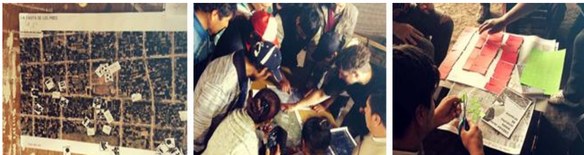
Figura 5: Imágenes de procesos de proyectos participativos

aplicadas en cada caso, todas tenían como objetivo final generar acuerdos en torno a las decisiones proyectuales.