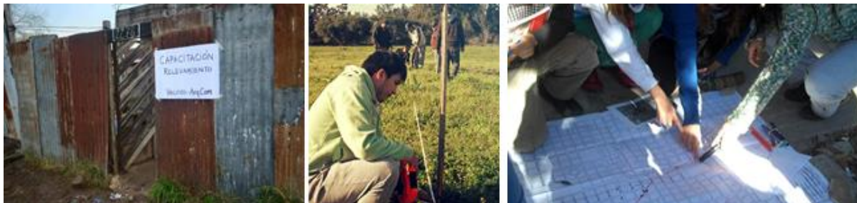
Figura 6: Imágenes de relevamientos

sociales, ambientales, políticos, etc. Partiendo de esa base, ArqCom trabajó con relevamientos socio-habitacionales, ambientales y técnicos.