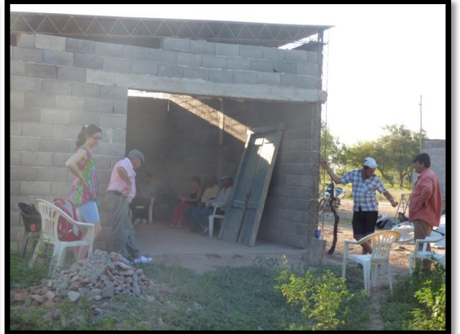
Reunión comunitaria. La Rinconada, Córdoba, Argentina. 2015