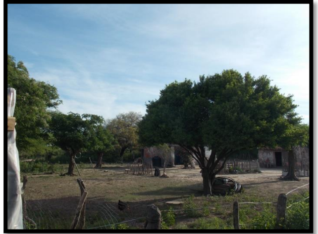
Reunión comunitaria. La Encrucijada, Córdoba, Argentina. 2014.