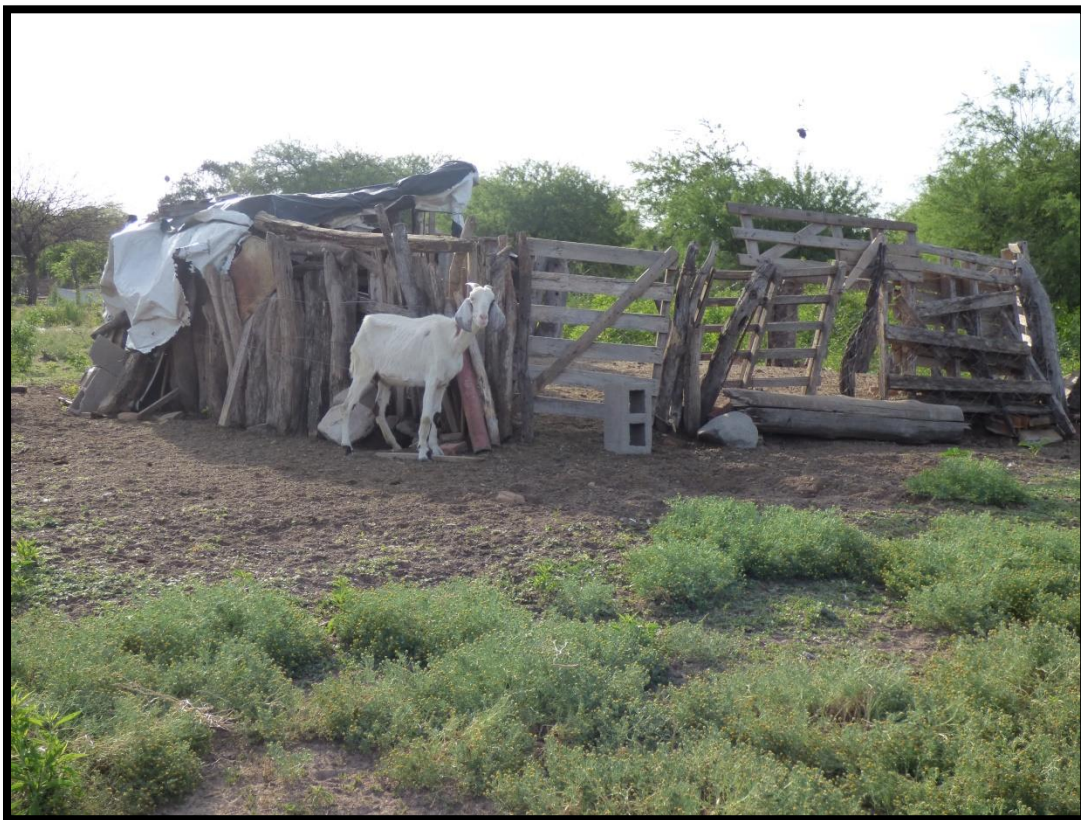
Producción campesina caprina. La Encrucijada, Córdoba, Argentina. 2014