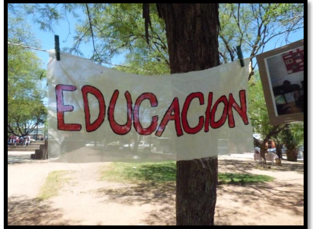
Gran Feria Campesina del Movimiento Campesino de Córdoba. Deán Funes (CBA), Argentina. 2014.