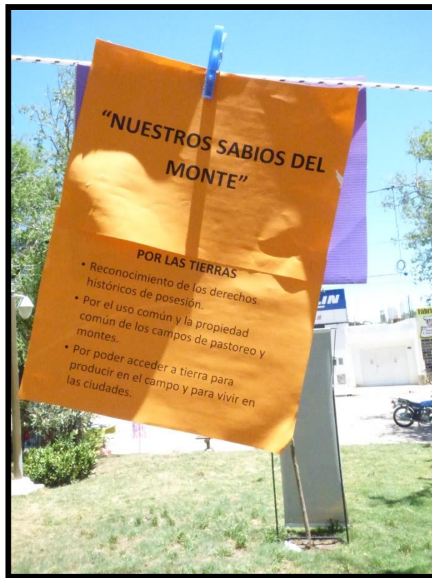
Gran Feria Campesina del Movimiento Campesino de Córdoba. Deán Funes (CBA), Argentina. 2014.