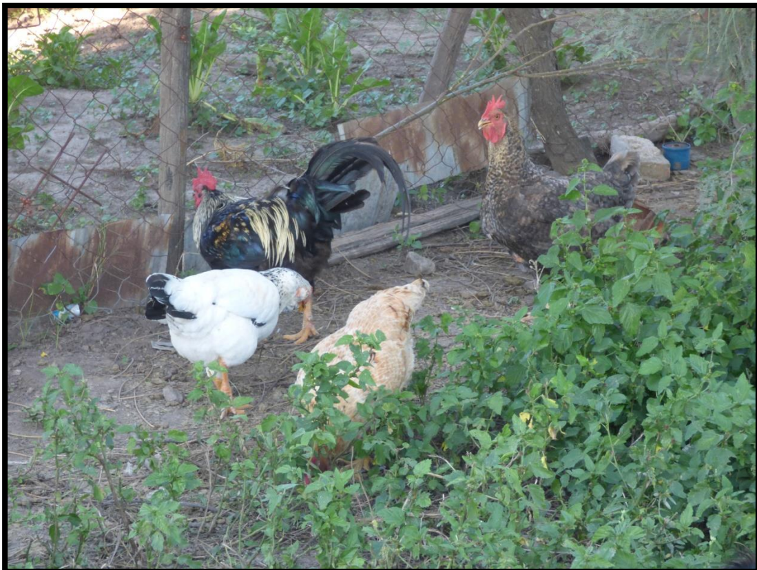
Producción campesina avícola. La Rinconada, Córdoba, Argentina. 2015