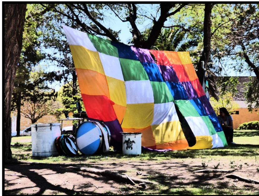
Gran Feria Campesina del Movimiento Campesino de Córdoba. Deán Funes (CBA), Argentina. 2014.