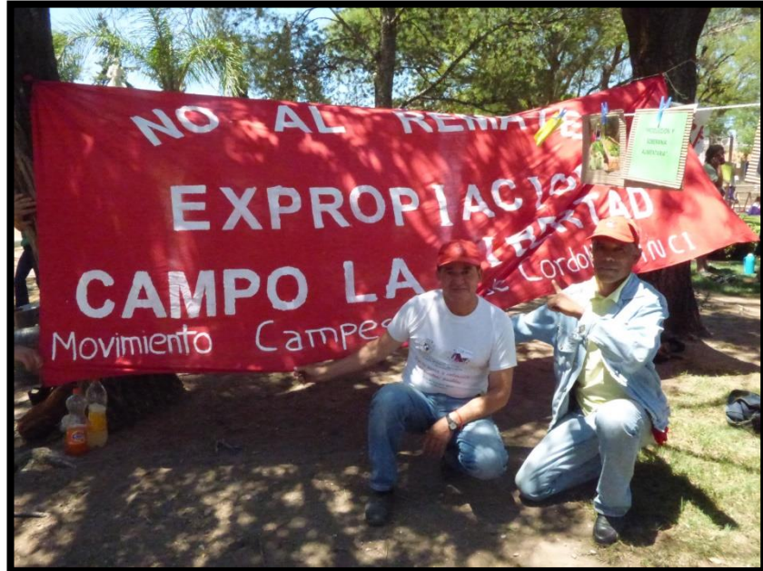
Gran Feria Campesina del Movimiento Campesino de Córdoba. Deán Funes (CBA), Argentina. 2014.