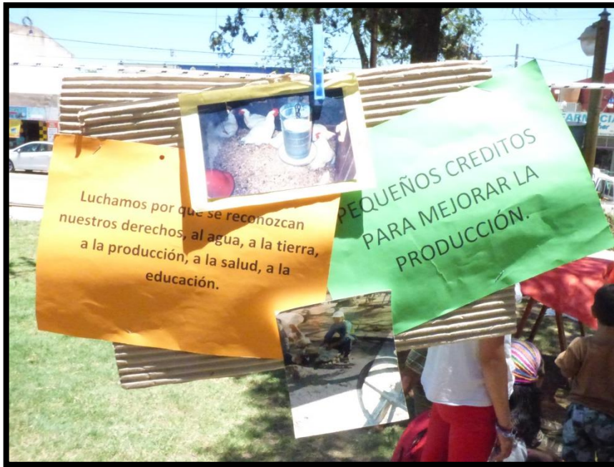
Gran Feria Campesina del Movimiento Campesino de Córdoba. Deán Funes (CBA), Argentina. 2014.