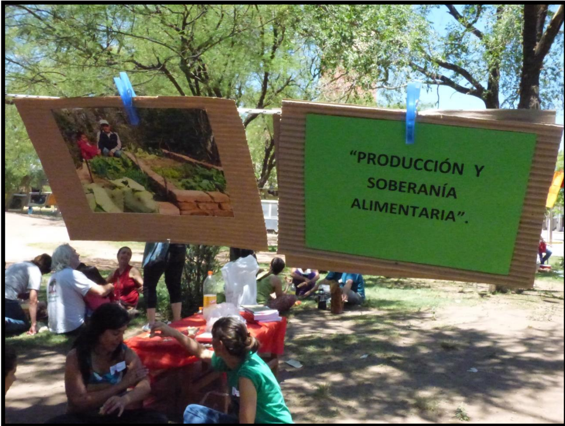
Gran Feria Campesina del Movimiento Campesino de Córdoba. Deán Funes (CBA), Argentina. 2014.