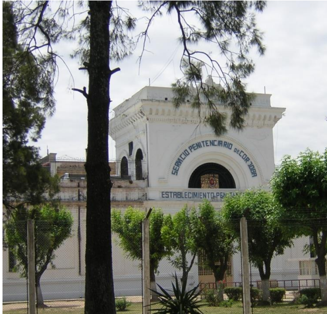
3. Fachada del Establecimiento Penitenciario N° 2 de la provincia de Córdoba, ubicado en el barrio San Martín de la ciudad de Córdoba capital, 2006.