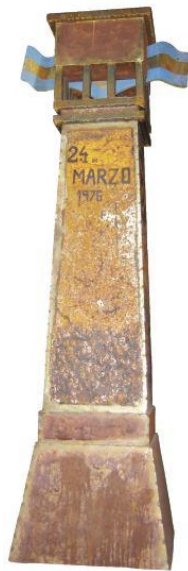
4. Escultura emplazada en la entrada del establecimiento penitenciario en conmemoración de los presos políticos asesinados durante la última dictadura militar.