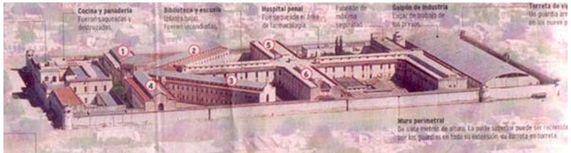
7. Infografía publicada en el diario La Voz del Interior , Córdoba, 12 de febrero de 2005.