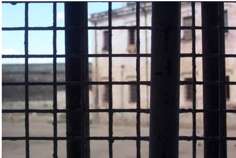
3. Vista de la ventana del aula en la que habitualmente se realizaban los encuentros del taller de periodismo en el penal de San Martín.