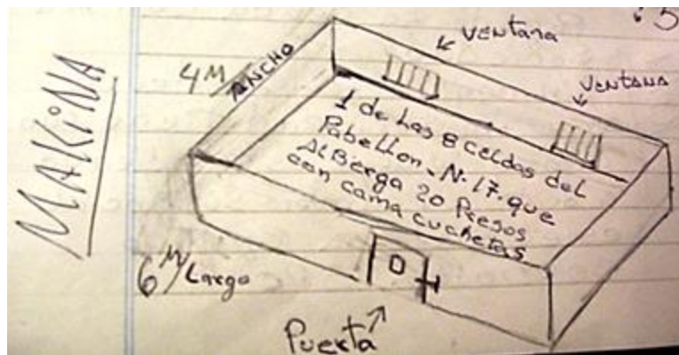
6. Gráfico realizado en 2003 por “Mákina”, uno de los reclusos que asistía al Taller de Periodismo en el penal de San Martín. En el dibujo se especifican las dimensiones de una de las celdas del pabellón 17 en la cual convivían veinte presos.