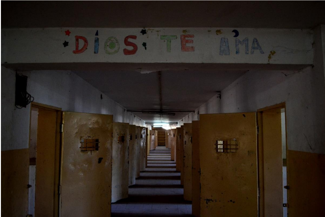
5. Celdas del pabellón 14, también utilizadas para castigo, en el penal de San Martín, Córdoba 1 .